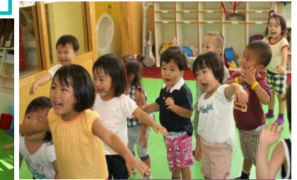
手を広げてカラス～ カーカー