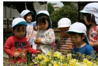
ありさん、みつけた！