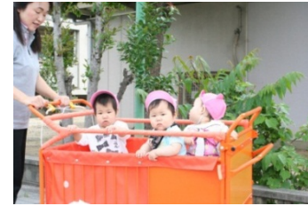
どこへ行こうかな？