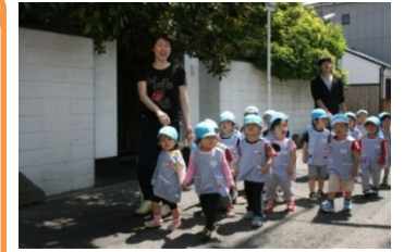
♪あるこう～ あるこう♪